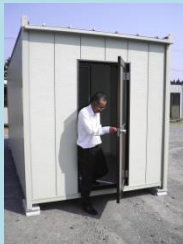
⑤入口とは反対側へ出る