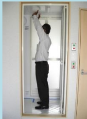
③殺菌水ミストで全身除菌