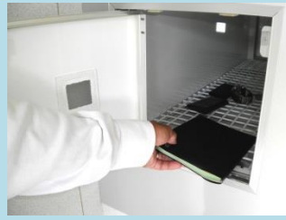
④殺菌した携行品を反対口より取り出す