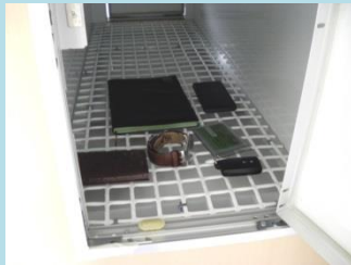
②携行品を殺菌灯で殺菌