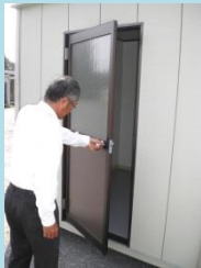
①更衣スペースへ入る

＜使い方手順＞ ※外着から作業着等への更衣を伴う場合は、①と②、④と⑤の間に、衣服の着脱の工程が入ります。